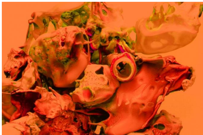
Jan Bastiaans, print op plexiglas, 60 x 80 cm, jaar 2023.